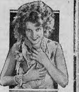
JEANETTE MACDONALD in "Let's Go Native" A Paramount Picture

Próximo Debut! Grandioso super estreno "Paramount" El más sugestivo espectáculo musical que ha producido el Cine!! Canciones! Bailes! Música! Alegría! Carcajadas! La suntuosa opereta de encanto seductor NAUFRAGOS DEL AMOR Creación suprema de la tiplera de la voz de oro Jeanette Mac Donald La inolvidable creadora de "El Desfile del Amor" El Torbellino de la gracia! El colmo de la opereta! Las más bellas mujeres Espectáculo Bataclánico incomparable!